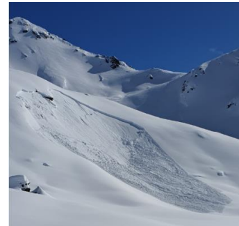
eine spontane Lawine 🤪

Zuerst für 2 Tage zuhinterst im Montafon, im Hotel Zerres in Partenen - da mit einer Skitour ab Gargellen Richtung Schweizergrenze (mit Blick nach den Klosterser- u. Davoser-Berge. (Übrigens das Montafon ein Super Ski (alpin)-Arena)