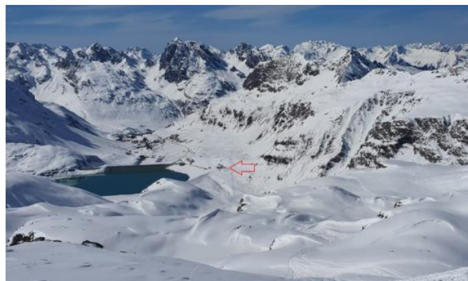
Das Berghotel Piz Buin auf der Bielerhöhe, eine super Touren-Basis