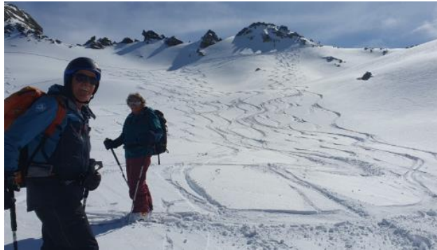
... dann Powdern, mit allen Konsequenzen...