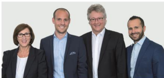
Das Team der Hauptagentur Hergiswil

«Wir wollen einen Berater, auf den wir uns verlassen können.»