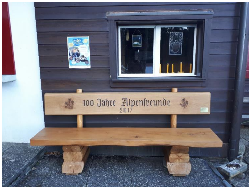
Bank vor der Schönenbodenhütte / Geschenk vom Skiclub Hergiswil zum 100-jährigen Jubiläum der Alpen Freunde Pilatus