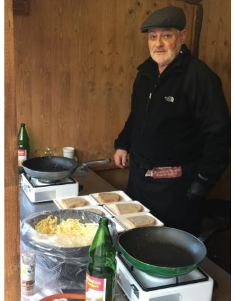
Dank dem Einsatz der fleissigen Helfer auch dieses Jahr wieder ein gelungener Anlass