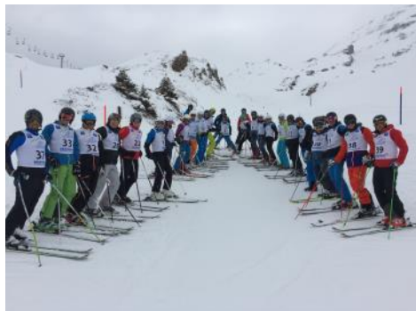
Ob dieses Jahr das Clubrennen im Langmattli stattfinden kann?

beim „Einstimmen“ mit dem Stollensalto wünscht euch