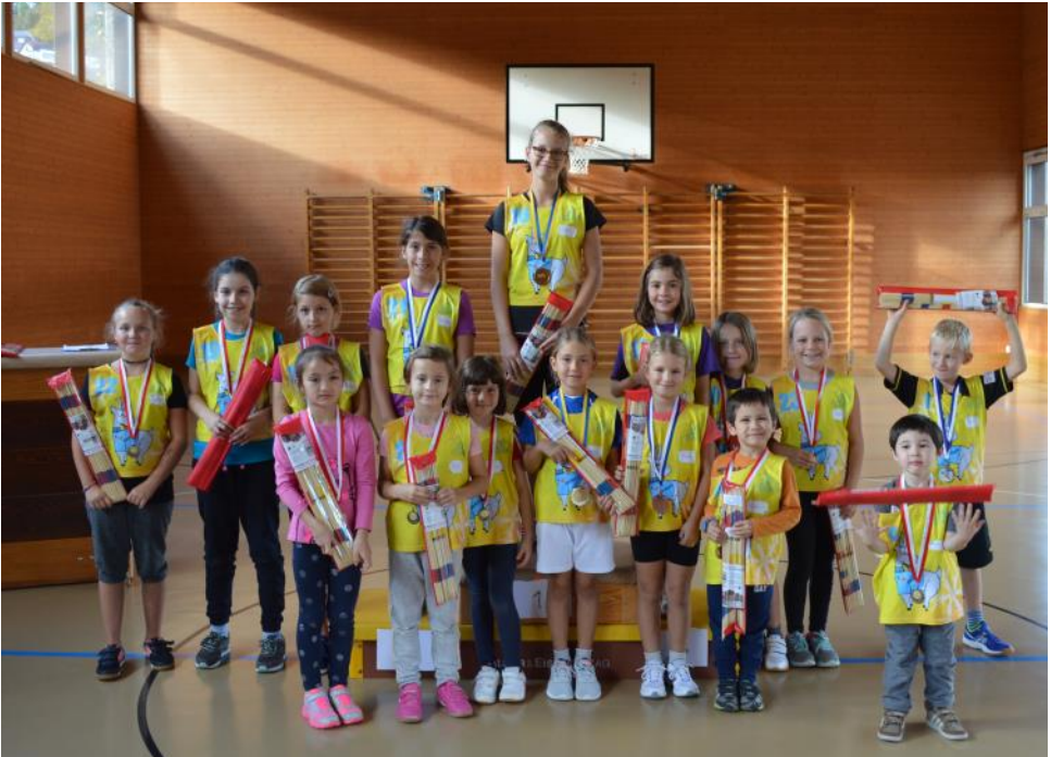
Impressionen vom JO-Plauschtag 2017